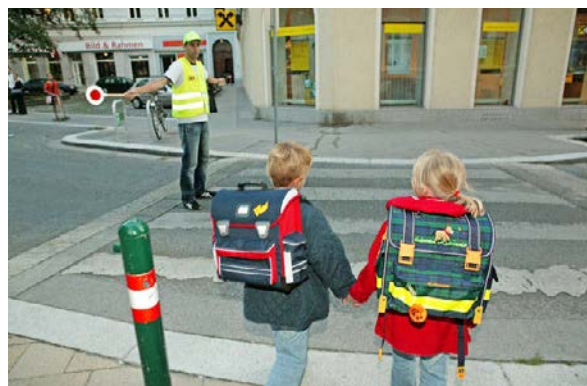
Die Sicherheit der Kleinen ist enorm wichtig – daher Schulwegsicherung!

Betrachtet man das Verkehrsunfallgeschehen, so ereignen sich zu Schulbeginn in der Zeit von 7 bis 8 Uhr die meisten Unfälle mit Kindern als Fußgänger. Zu Schulseende in der Zeit zwischen 12 und 14 Uhr ist wieder ein Anstieg der Unfallzahlen festzustellen. Die hohen Unfallanteile am Nachmittag sind in Zusammenhang mit Freizeitaktivitäten und damit verbunden mit vermehrtem Aufenthalt im Straßenraum zu sehen. Die Sicherung des Schulweges ist eine wichtige Aufgabe, um unsere jüngsten Verkehrsteilnehmer vor den Gefahren des Straßenverkehrs zu schützen.