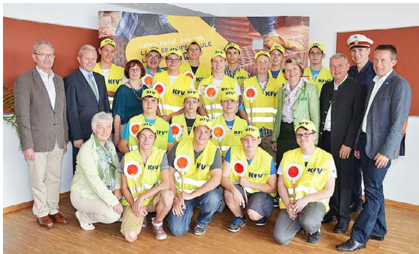
2014 – Feier „45 Jahre Schülerlotsen Berufsschule Langenlois“

In der Regel wird in Niederösterreich die Schulwegsicherung auf Bundes- oder Landesstraßen durchgeführt. Die Behörde ist hierbei die Bezirksverwaltungsbehörde (Bezirkshauptmannschaft, Magistrat oder Bundespolizeidirektion). Wird die Schulwegsicherung auf einer Gemeindestraße durchgeführt, wäre die jeweilige Gemeinde die zuständige Behörde. Diese Aufgabentrennung führte in manchen Gemeinden zu zwei Behördenwegen. Finden Schulwegsicherungen auf Gemeindestraßen und Bundes- oder Landesstraßen statt, führen in der Regel die Bezirkshauptmannschaften auch die behördlichen Aufgaben der Gemeinden aus.