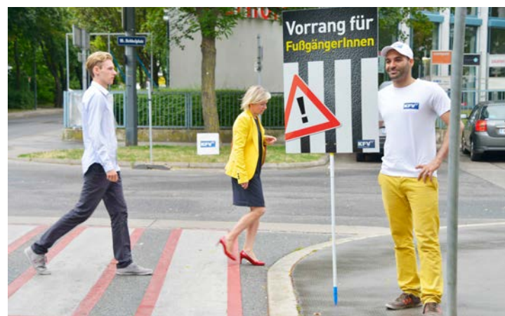
„Vorrang für Zebras“ – eine Aktion des Kuratoriums für Verkehrssicherheit für partnerschaftliches Denken und Handeln im Straßenverkehr.

Wird eine Schulwegsicherung eingerichtet, muss diese verlässlich ausgeführt werden. Bei plötzlichem Entfall wären die Kinder stark verunsichert und großen Gefahren ausgesetzt. Ersatzpersonen sollen nominiert werden. Es ist nicht anzunehmen, dass Schulleitungen oder Gemeinden Personen zur Sicherung bestimmen oder die Sicherungstätigkeit kontrollieren. Daher soll die gesamte Organisation der Schulwegsicherung von den Eltern bzw. interessierten Personen durchge-